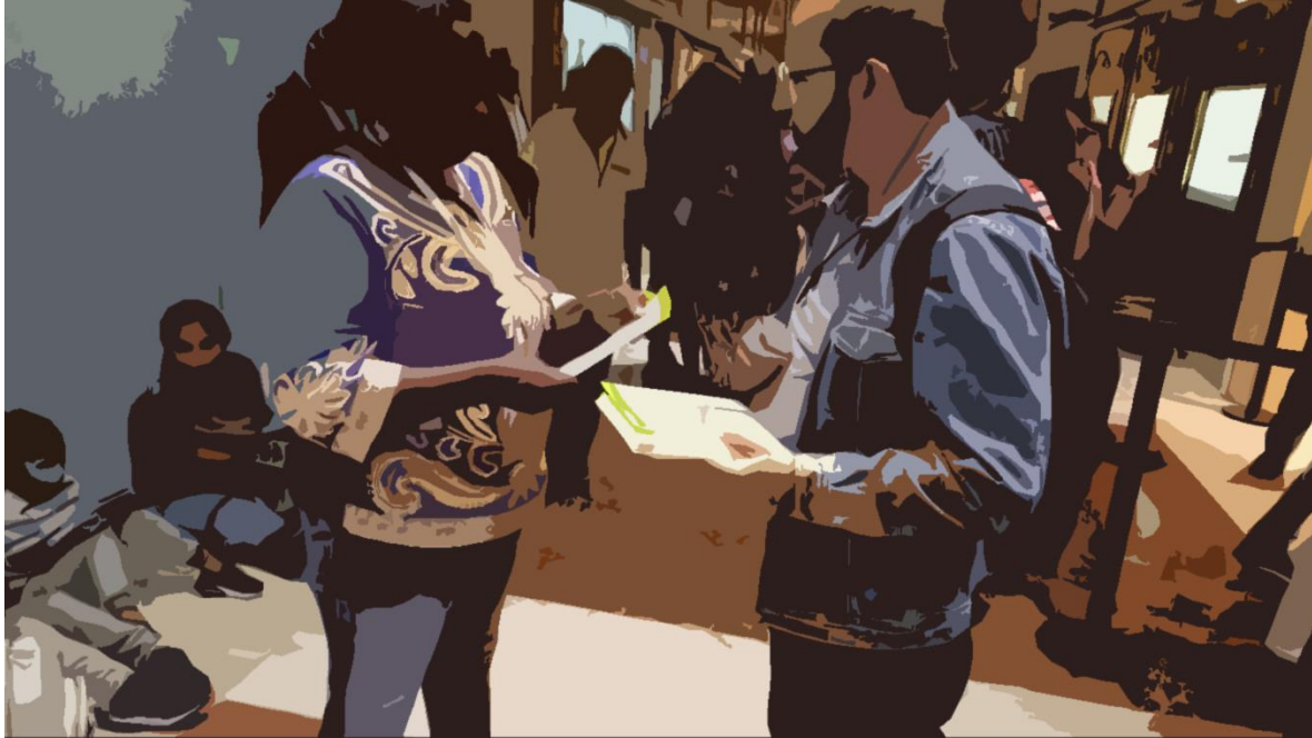
Entrega de volantes impresos a líderes y lideresas de la Mesas Municipales y organizaciones de víctimas en la Cumbre Nacional de Víctimas el 1 y 2 de febrero en el Hotel Tequendama

Cumbre Nacional de Víctimas en Bogotá y de la Primera semana de trabajo en el Archivo Histórico de víctimas de mina en el Nororiente AMOVIC-UIS